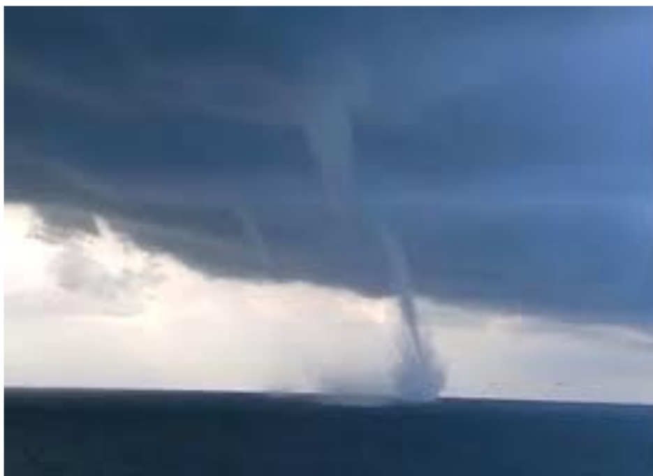
11 дүгээр зураг. Борооны бөөн үүлтэй холбоотой нөөлөг салхи

Нөөлөг салхи. Энэ нь гэнэтийн, огцом, богино хугацаанд (хэдхэн хормын турш) салхины хүч ихсэж, хурд нь 15 м/с-ээс их болох, мөн чиглэл нь огцом өөрчлөгдөх үзэгдэл юм. Нөөлөг салхины хурд 20...30 м/с хүрэх нь цөөнгүй, 40 м/с-ээс давах тохиолдол ч тэмдэглэгджээ. Энэ үзэгдэл ихэвчлэн фронтын, агаарын дотоод массын борооны бөөн үүлтэй холбоотой ажиглагдана (11 дүгээр зураг). Аль ч тохиолдолд энэ нь эргэлтийн хэвтээ тэнхлэг бүхий агаарын хуйлрах хөдөлгөөн бөгөөд үүлэн дотор юмуу үүлэн дор үүснэ.