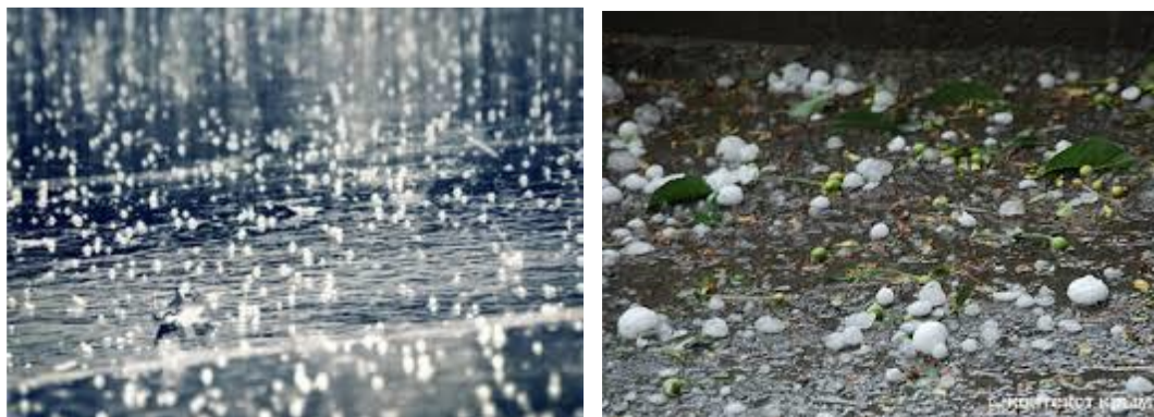
8 дугаар зураг. Мөндөр орж буй болон газарт унасан мөндрийн ширхэг

Мөндөр нь тунадасны төрлүүдээс хамгийн аюултайд тооцогддог бөгөөд агаарын дотоод массын, мөн фронтын гаралтай борооны бөөн үүлнээс орно (8 дугаар зураг). Хамгийн их хүчтэй мөндөр голчлон хүйтэн фронт дайрч өнгөрөхөд ажиглагдана. Судалгаанаас үзэхэд мөндөртэй өдрийн тоо газрын дэвгэр гадаргын онцлогоос ихээхэн хамаардаг бөгөөд тал газрыг бодоход уулархаг газарт илүү их байна. Мөндөр нь голдуу үдээс хойш, дулааны конвекц хамгийн дээд шатанд хүрэх үед орно. Орон зайн тархалтын хувьд жигд бус хуваарилалтай байна. Мөндрийн үргэлжлэх хугацаа голчлон 5 минут орчим, заримдаа 6...15 минут, бүр онцгой ховор тохиолдолд 1 цаг хүртэл, түүнээс их хугацаагаар орно. Мөндрийн ширхэгийн хэлбэр янз бүр, голч нь 5...10 мм хүрнэ.