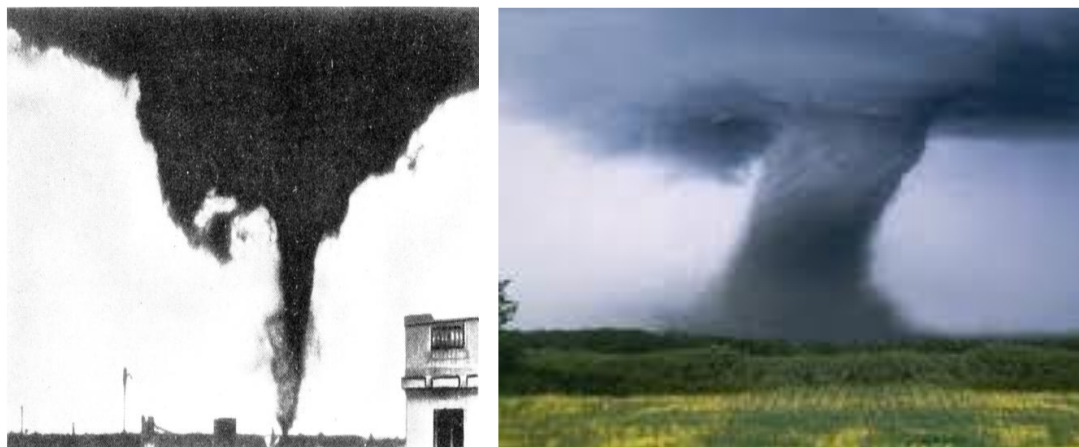
12 дүгээр зураг. Догшин хуй салхи

Догшин хуй салхи. Догшин хуй салхи нь борооны бөөн үүлэнд бий болдог, газрын гадаргад эгц босоо, хааяа тахирласан тэнхлэгийг тойрон эргэж байгаа юүлүүр маягийн хуйлраа үүсгэдэг хуй салхи юм.