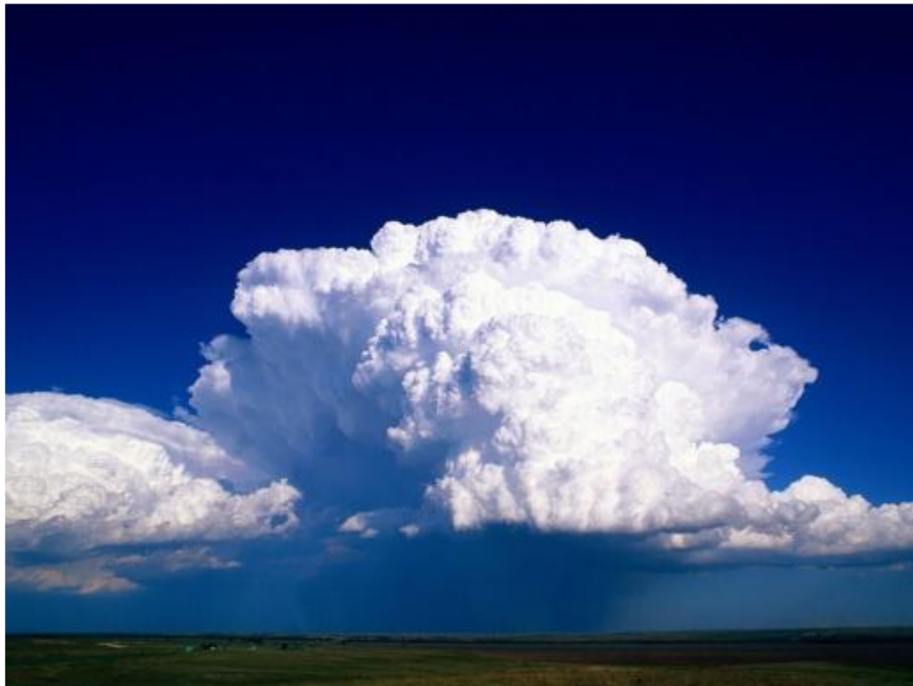
1 дүгээр зураг. Борооны бөөн үүл түгээмэл дүрс

Борооны бөөн үүлнээс дулаан улиралд аадар бороо, мөндөр орж, аянга цахилгааны үзэгдэл ажиглагдана. Аадар бороо орох үед солонго татна. Мөн энэ үүлтэй холбоотой нөөлөг салхи, догшин хуй салхи гарах нь цөөнгүй. Өвлийн цагт аадар цас орно. 1, 2, 3, 4, 5 дугаар зургуудад борооны бөөн үүлний түгээмэл гадаад байдлыг үзүүлэв.