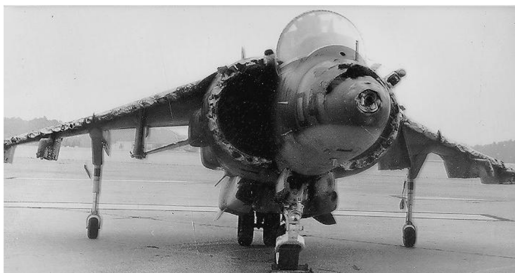
9 дүгээр зураг. Мөндөрт өртсөн онгоцны байдал

Мөндөр нь хөдөө аж ахуйн үйлдвэрлэл, нэн ялангуяа газар тариалан, эрчим хүч, зам тээвэр, түүний дотор агаарын тэврийн үйл ажиллагаанд нэн хор нөлөөтэй үзэгдэл юм. 9 дүгээр зурагт мөндөрт өртсөн онгоцны байдлыг үзүүлэв.