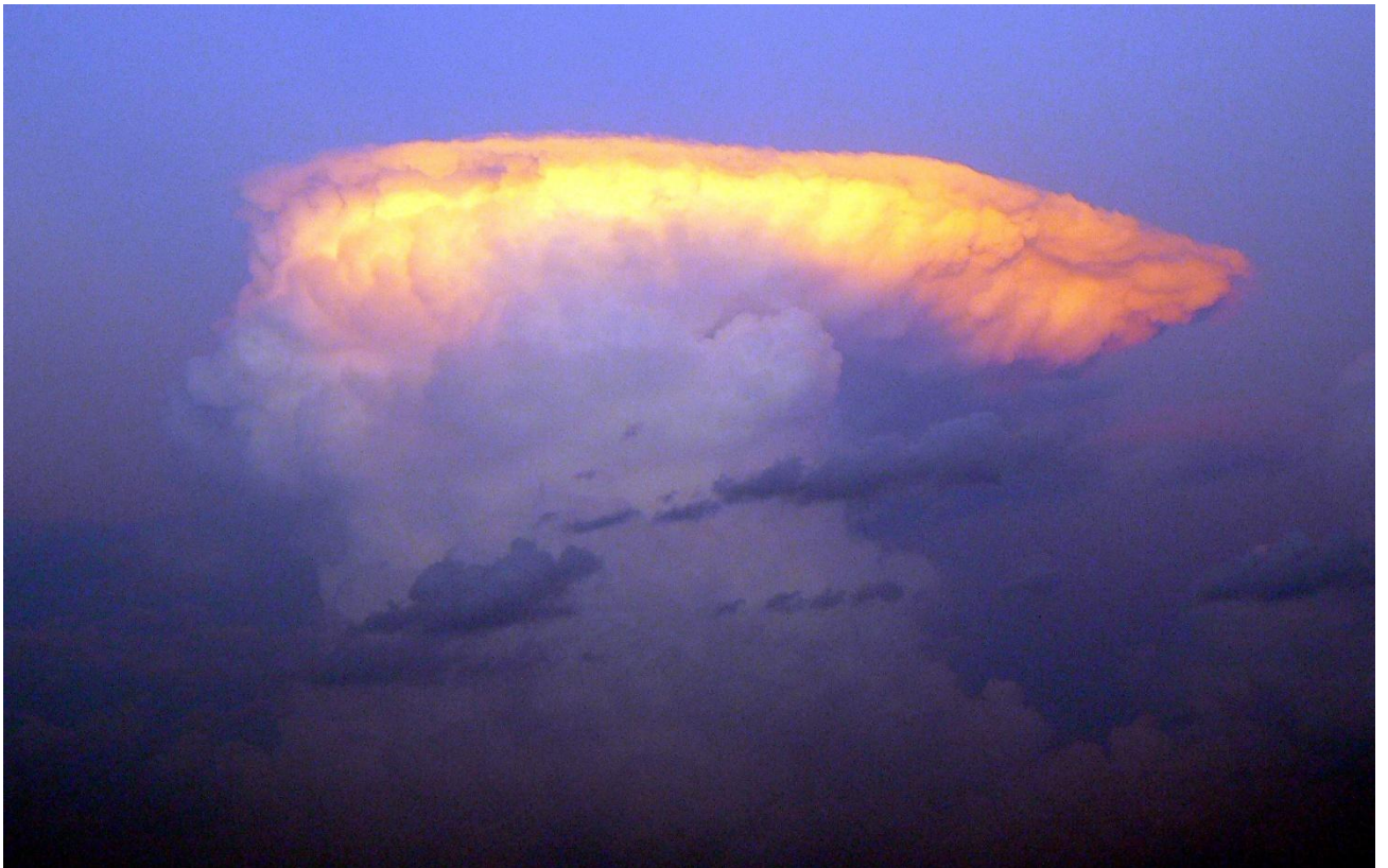
3 дугаар зураг. Борооны бөөн үүл (аянгын хажлагатай)