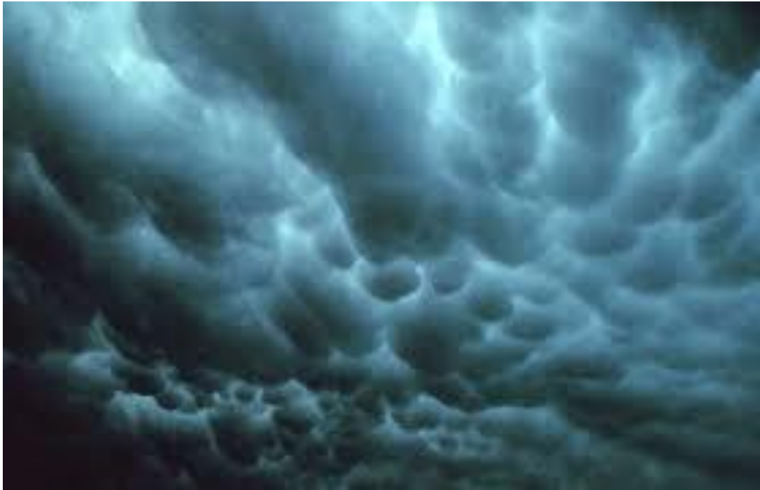
4 дүгээр зураг. Борооны бөөн үүл (дэлэн хэлбэрийн)