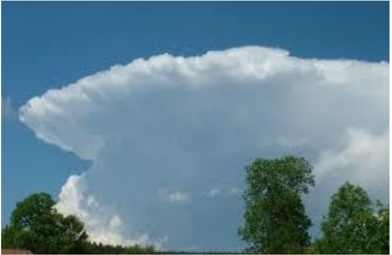
2 дугаар зураг. Борооны бөөн үүл (дөш маягийн)