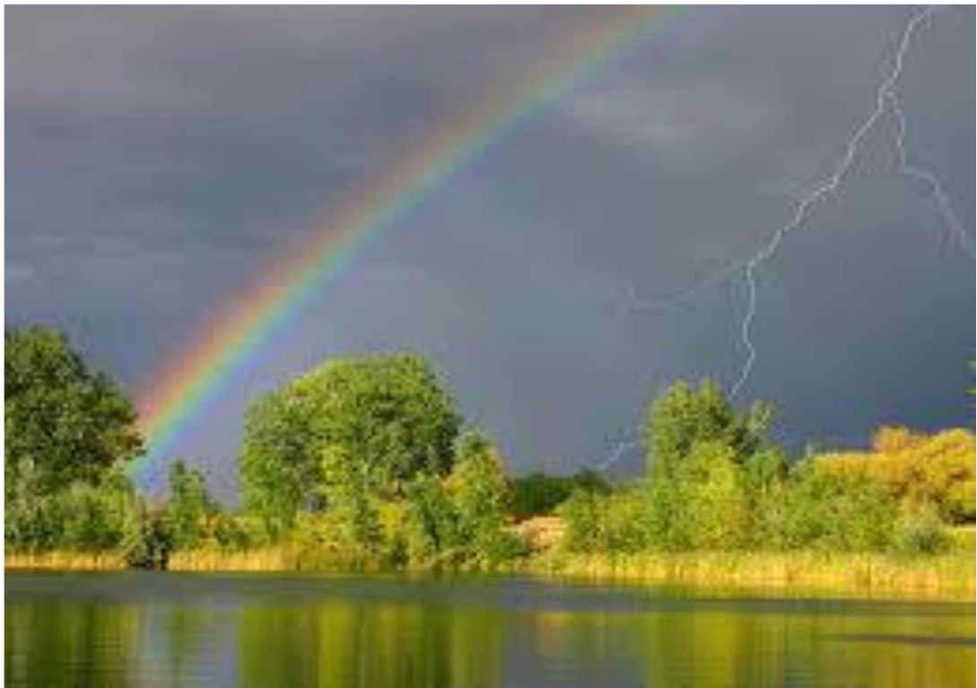
5 дугаар зураг. Борооны бөөн үүлэнд татсан солонго