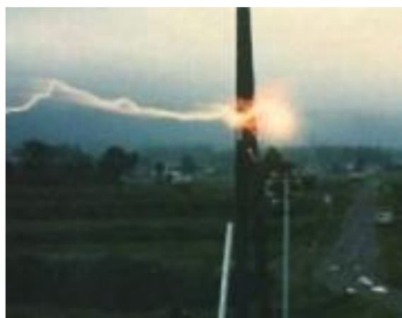
10 дугаар зураг. Шугаман болон бөмбөлөгөн аянгийн ниргэлт

Аянгийн давтагдал, тархац. Газрын гадаргын хотгор, гүдгэрийн улмаас тус орны өөр өөр хэсэгт аянгийн давтагдал харилцан адилгүй байна. Хангай, Хэнтийн уулархаг мужид жилд дундажаар 25-36 өдөр аянгатай, тэдгээр мужаас холдох тутам аянгийн давтагдал эрс буурч тал хээр газар 15-25 өдөр болно. Жилд 36 өдөр хүртэл аянгатай байдаг Дадал, Хужирт орчмын нутаг нь тус орны аянгийн хамгийн их давтагдалтай нутаг юм.